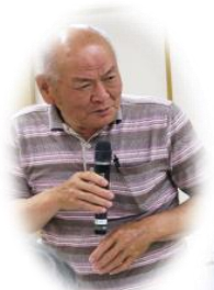
お世話になりました