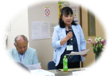
司会お疲れ様でした