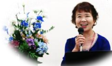
今年度も皆さま元気で活躍しましょう